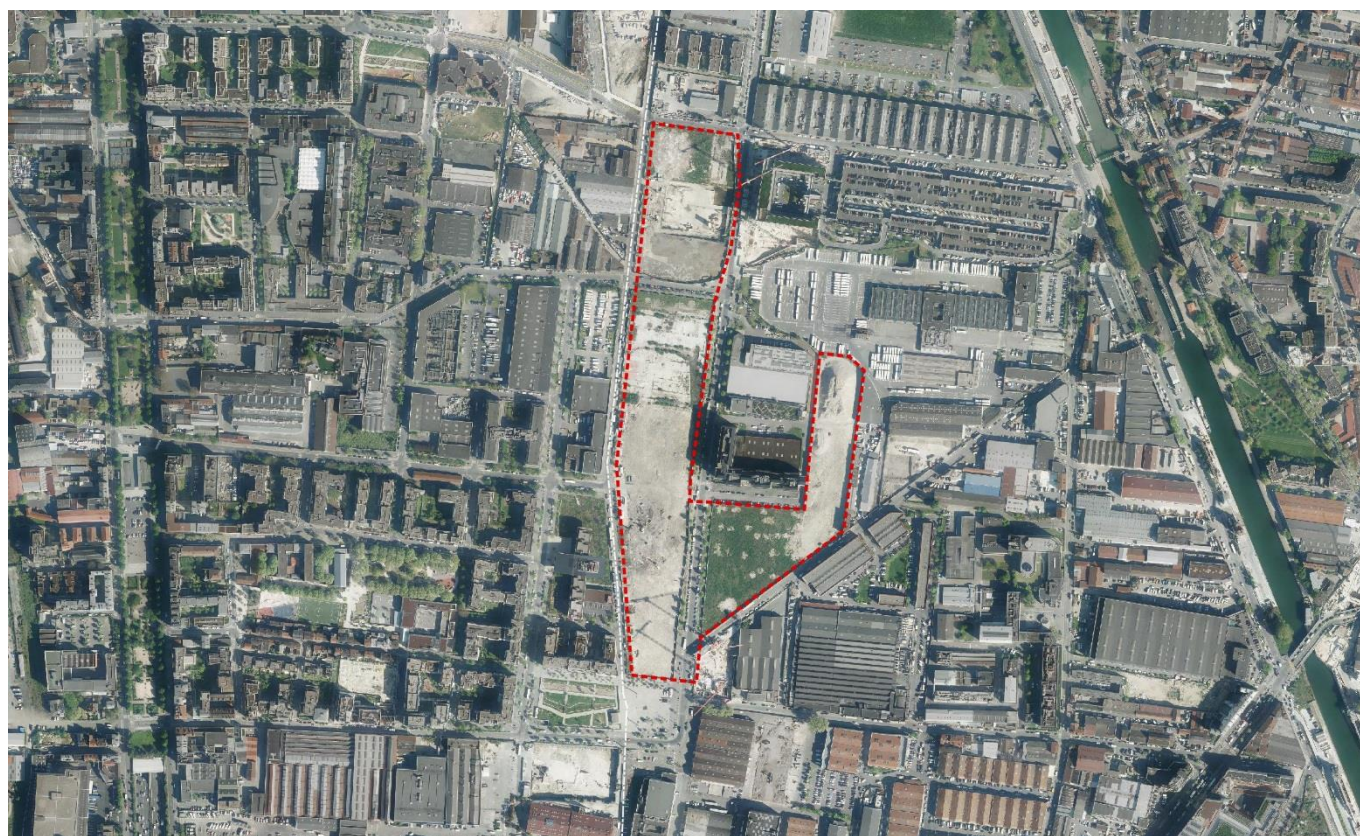
vue satellite et périmètre de l'OAP