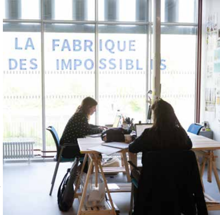
Pôle ESS – L'Île-Saint-Denis