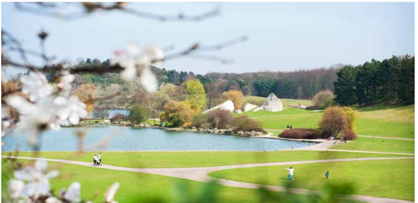
Parc départemental Georges-Valbon, anciennement parc de La Courneuve