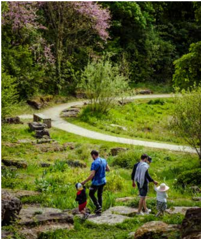
Butte Pinson – Pierrefitte-sur-Seine

Le territoire ambitionne de proposer un mode de vie qui assure le bien-être et la santé de tous, inscrit dans une dynamique de transformation écologique qui participe de son attractivité. Plaine Commune affirme la nécessité d'un urbanisme favorable à la santé, de l'accès à la nature, d'espaces publics de qualité,