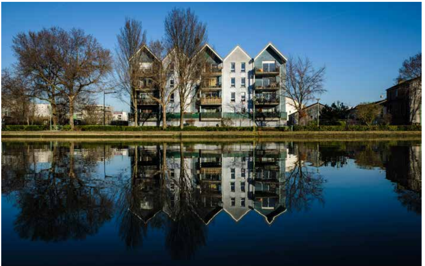
Berges du Canal de Saint-Denis

En partant des besoins des habitants, il cherche à dépasser le paradigme de la course des territoires vers l'attractivité à tout prix des acteurs extérieurs, qui conduit à produire des modèles génériques dupliqués dans toutes les grandes villes, finalement bien peu attractifs. Il vise au contraire à révéler et à capitaliser sur la singularité du territoire, tout en le transformant, pour en faire un lieu qui suscite la curiosité de venir, tout comme le désir d'y rester pour vivre, étudier, travailler, s'engager, créer !