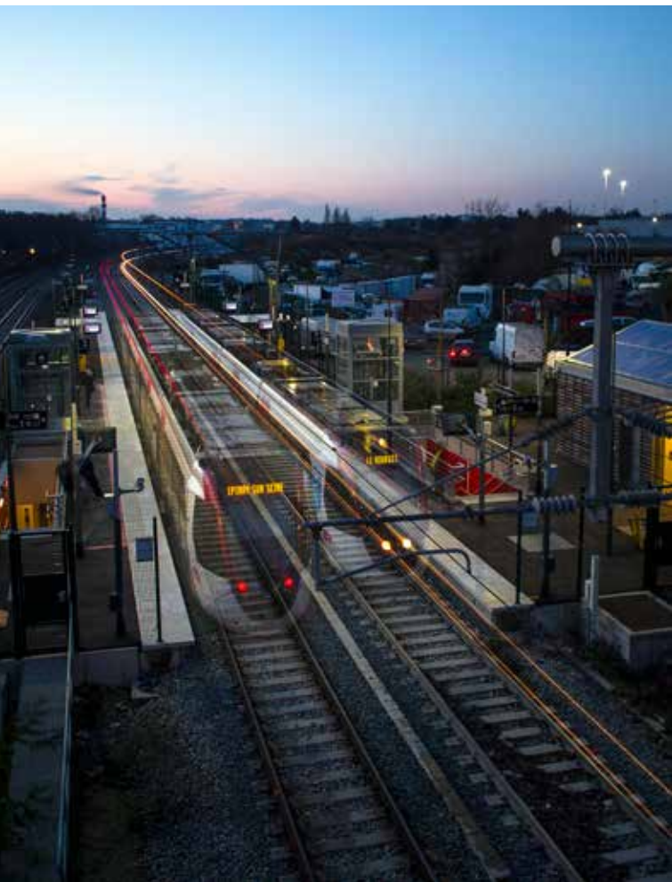
Tramway T11 – Stains