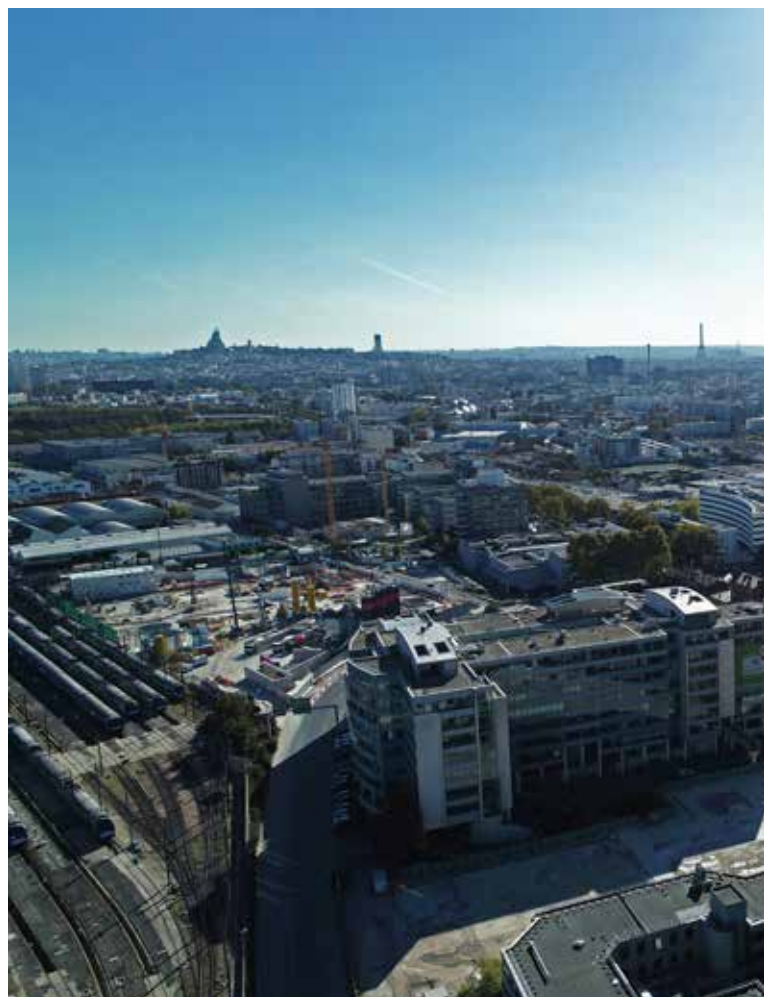
Tour Pleyel – Saint-Denis

mais également pour les activités à fort niveau de savoir ajouté. Ainsi la recherche, l'innovation et les technologies n'offrent aujourd'hui que peu d'emploi local aux étudiants du territoire, pourtant nombreux. En travaillant de concert la question des qualifications, de la formation et des débouchés, ainsi que la coopération écoles-entreprises, Plaine Commune a vocation à constituer et consolider des écosystèmes économiques. Les compétences non qualifiées (diversité des langues parlées, savoirs issus de l'expérience, etc.), seront également des points d'appui forts. Plaine Commune s'attachera enfin à renforcer son soutien aux projets d'économie sociale et solidaire qui placent l'humain au cœur de l'activité, et représentent déjà plus de 5 % des établissements employeurs du territoire.