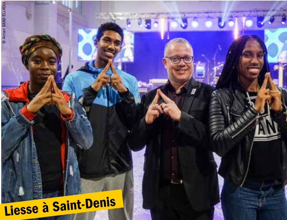
Liesse à Saint-Denis

Malgré les trombes d'eau, les Dyonisiens se sont rassemblés, mercredi 13 septembre, en soirée, pour célébrer la désignation officielle de Paris comme ville d'accueil des Jeux olympiques et paralympiques 2024.